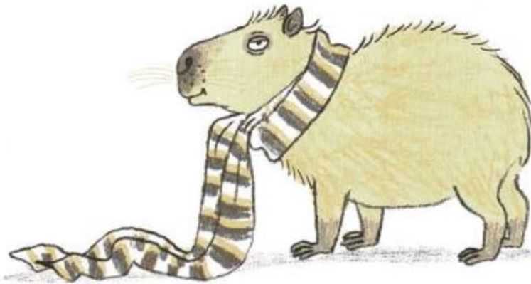
Afb. 2 DE CAPIBARA ( Hydrochoerus hydrochaeris )

Als je vrienden wilt worden met een dier, kies er dan op z'n minst eentje dat geen mensen eet.*