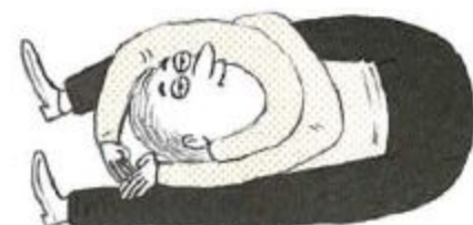
Vouw met Gebogen Armen, ook wel genoemd: 'Draaikolk'