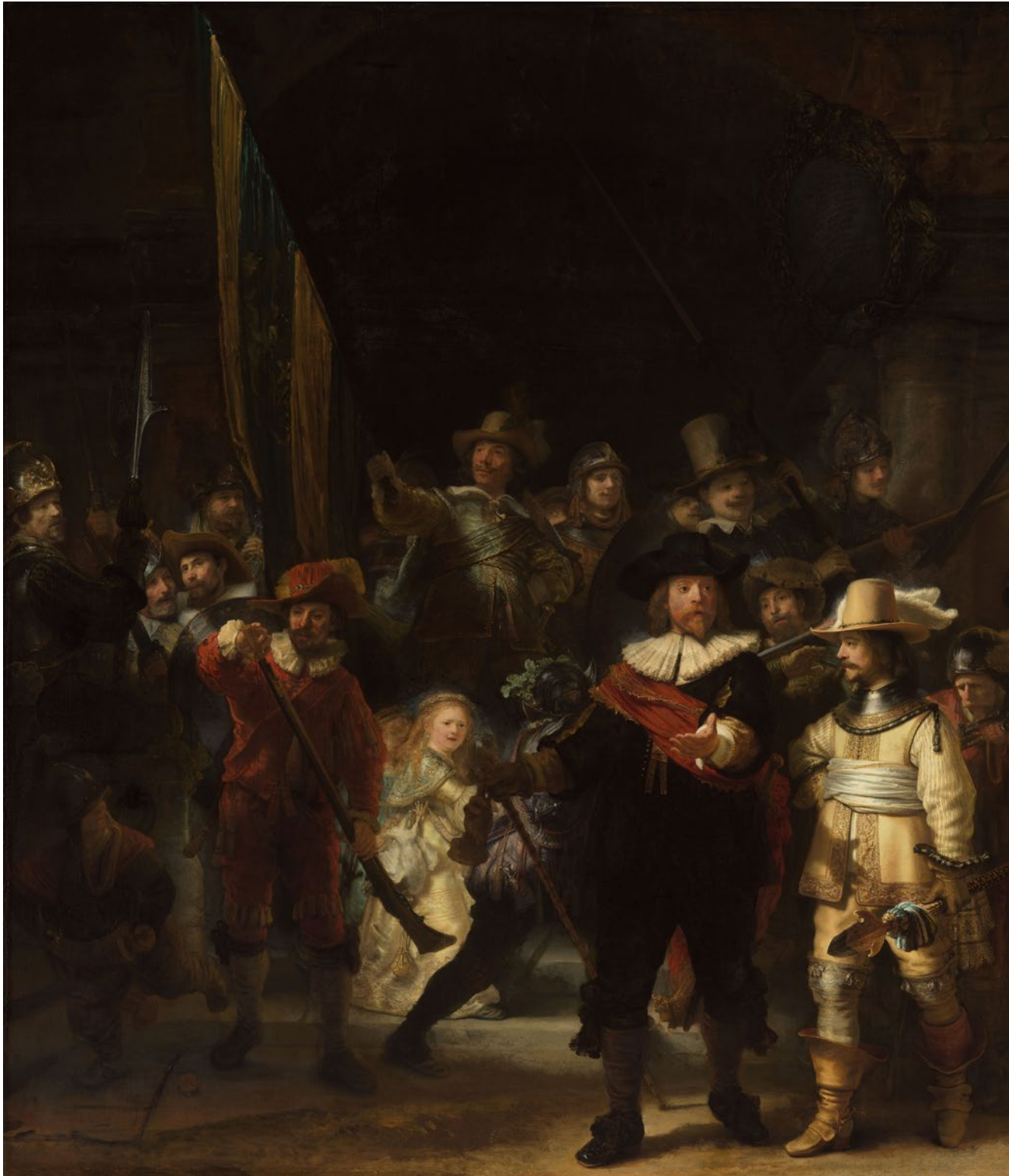
De Nachtwacht, gemaakt in 1642