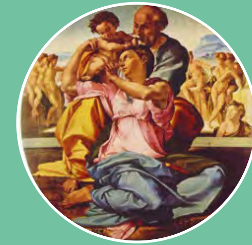
MICHELANGELO, TONDO DONI, 1504 UFFIZI, FIRENZE

Michelangelo was een geniale kunstenaar die gebouwen ontwierp, standbeelden kapte uit grote blokken steen en gigantische muurschilderingen maakte. Zijn allerberoemdste kunstwerk is het reuzegrote schilderij op het plafond van het paleis van de paus. Maar heel af en toe maakte hij ook een zeldzaam 'los' schilderij.