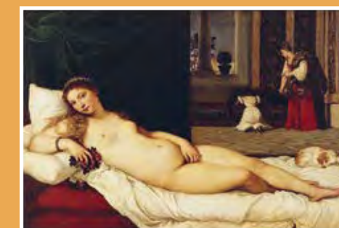
TITIAAN, VENUS VAN URBINO, 1538