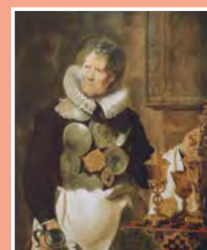
CORNELIS DE VOS, ABRAHAM GRAPHEUS, 1620