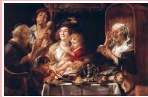
JACOB JORDAENS, ZOALS DE OUDEN ZONGEN, PIEPEN DE JONGEN, 1638 KMSK, ANTWERPEN

Jacob Jordaens was een van de allerbelangrijkste kunstenaars uit de BAROKTIJD . Hij hield van felle kleuren en schilderijen propvol mensen. Hier schilderde Jacob een spreekwoord. Dat werd vroeger heel vaak gedaan. Spreekwoorden waren heel populair.