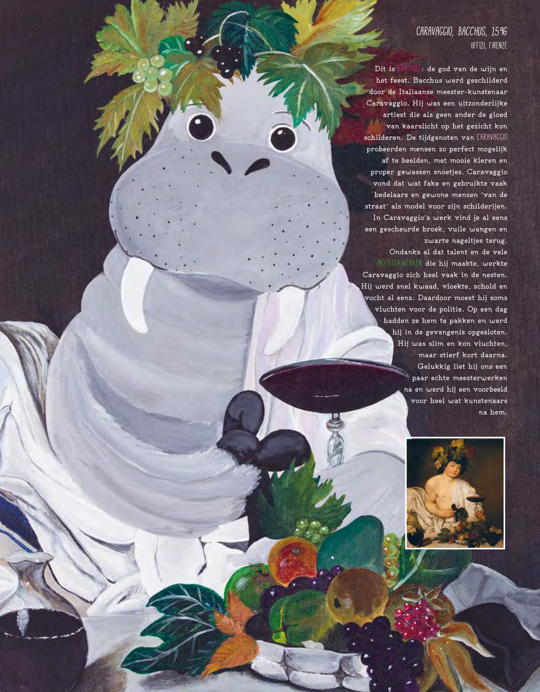
CARAVAGGIO, BACCHUS, 1596 UFFIZI, FIRENZE

Dit is BACCHUS : de god van de wijn en het feest. Bacchus werd geschilderd door de Italiaanse meester-kunstenaar Caravaggio. Hij was een uitzonderlijke artiest die als geen ander de gloed van kaarslicht op het gezicht kon schilderen. De tijdgenoten van CARAVAGGIO probeerden mensen zo perfect mogelijk af te beelden, met mooie kleren en proper gewassen snoetjes. Caravaggio vond dat wat fake en gebruikte vaak bedelaars en gewone mensen 'van de straat' als model voor zijn schilderijen.