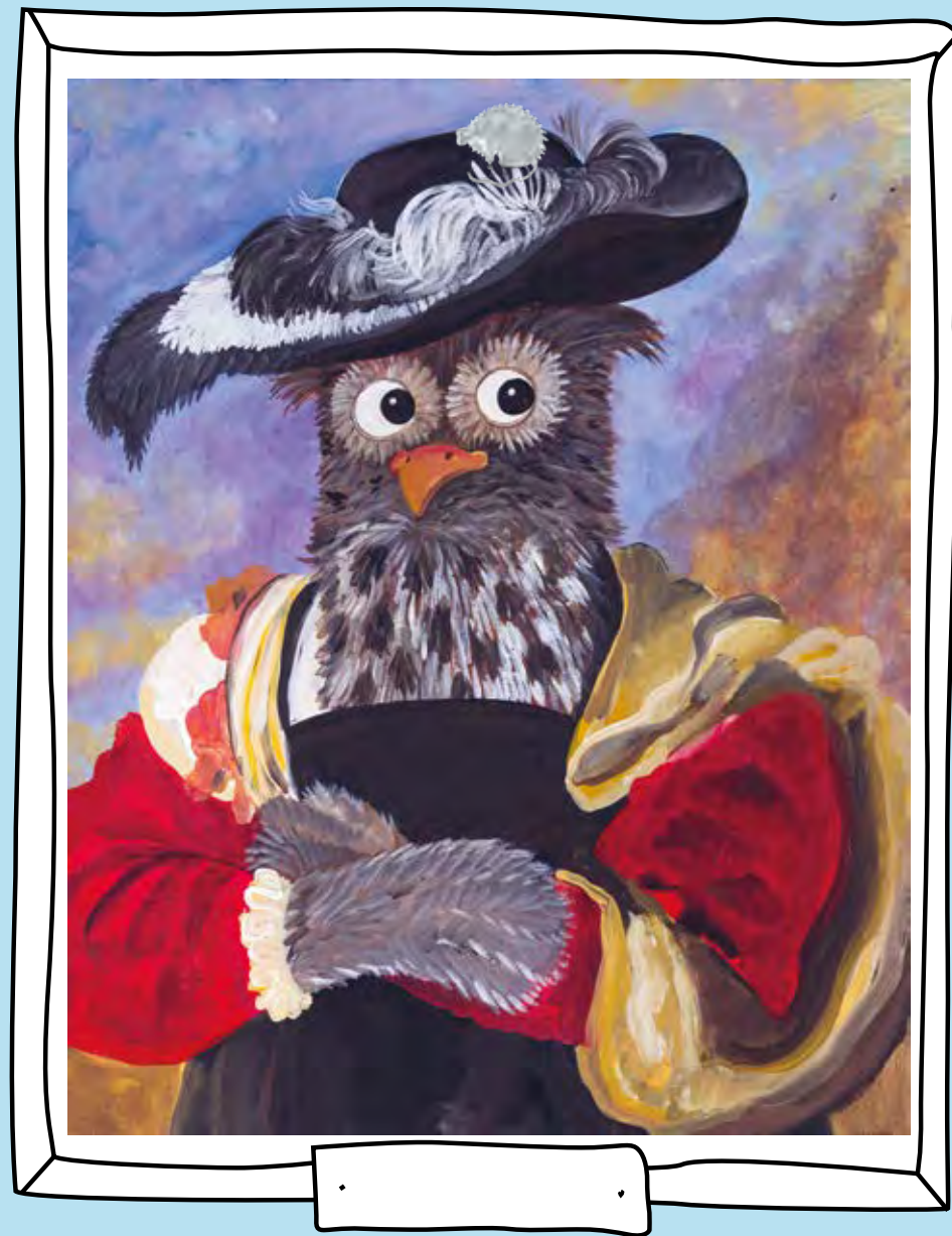
PETER PAUL RUBENS, DE STROHOED, 1622