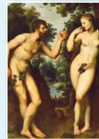
PETER PAUL RUBENS, ADAM EN EVA, 1598-1600 RUBENSHUIS, ANTWERPEN

Ook geniale schilders als RUBENS moesten eerst alle kneepjes van het vak leren bij een meester. Rubens' meester was Otto van Veen. Na een paar jaartjes schoollopen bij Otto vond Rubens het welletjes. Hij was klaar om zelf ' KUNSTSCHILDER ' te worden. Dit Adam en Eva-schilderij is een van de eerste schilderijen die Rubens na zijn schooltijd schilderde. Je kan er nog wel een beetje Otto's stijl in herkennen. Maar heel wat kenners vinden dat Rubens zelfs toen al beter was geworden dan zijn meester. Zoveel talent had hij! Hij schilderde het verhaal van ADAM EN EVA later nog een paar keer. Heel veel kunstenaars vonden dat trouwens een prachtig onderwerp. Het verhaal komt uit het eerste hoofdstuk van de Bijbel. Het gaat zo: God - de bedenker en maker van de wereld - blies in een hoopje zand en floep, daar was Adam. De allereerste mens! Toen nam hij een stukje van Adam en boetseerde daar Eva mee. Adam en Eva kregen een prachtig paradijs vol bloemen en sappig fruit. En ze gingen nooit dood. Maar er was wel één huisregel. Ze mochten niet eten van de appels van de boom van ' GOED & KWAAD '.