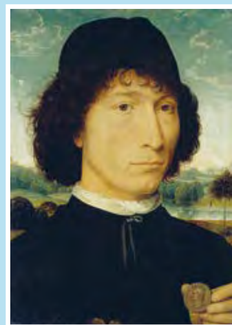
HANS MEMLING, MAN MET ROMEINSE MUNT, ROND 1480 KMSK, ANTWERPEN