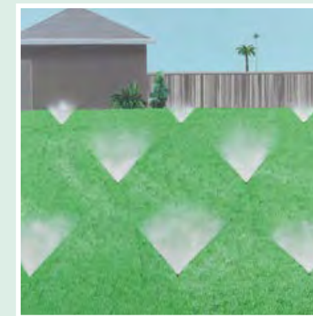
DAVID HOCKNEY, A LAWN BEING SPRINKLED , 1967