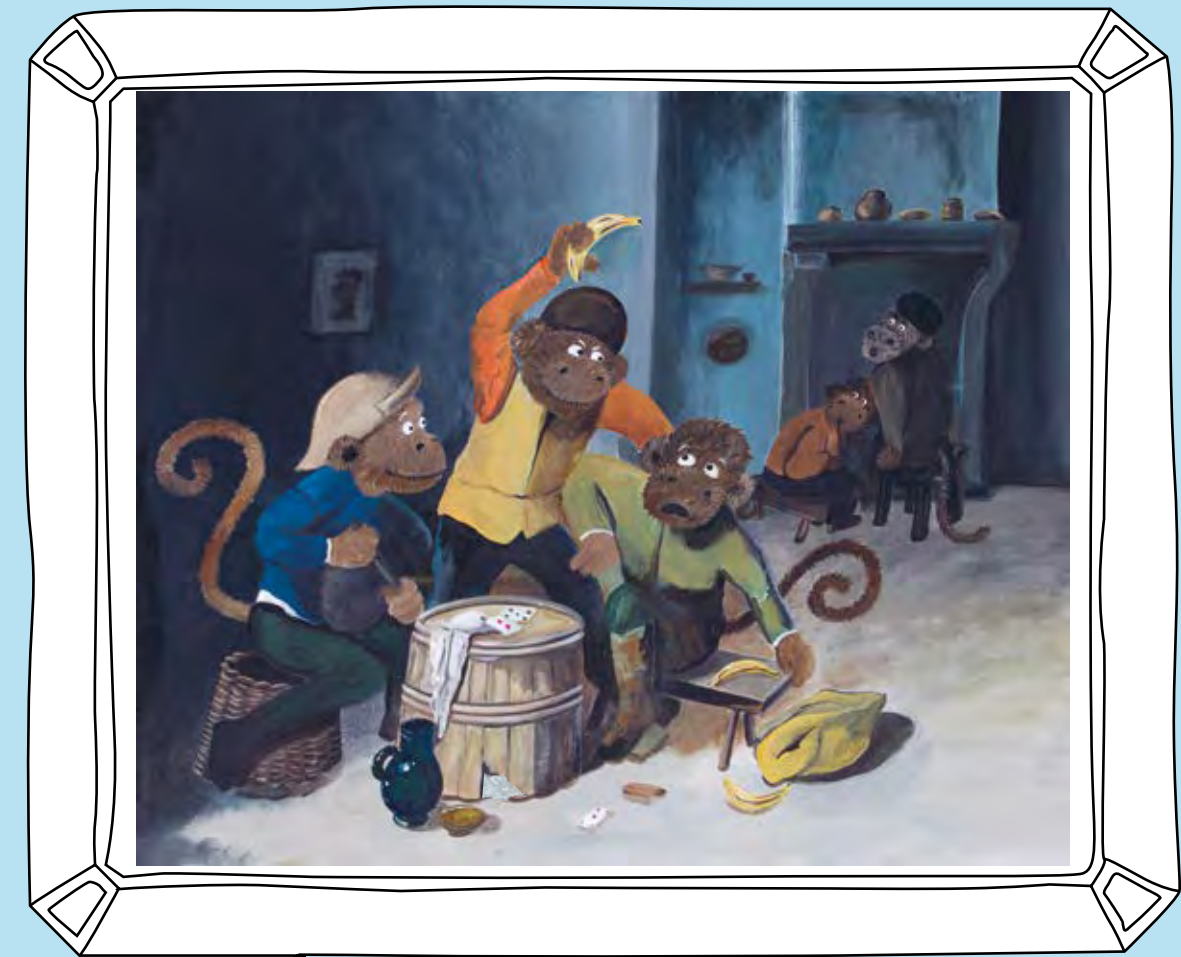
ADRIAEN BROUWER, BOERENVECHTPARTIJ, 1630