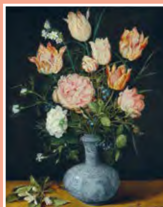
JAN BRUEGHEL DE OUDE, WAN-LI-VAAS MET BLOEMEN, ROND 1610