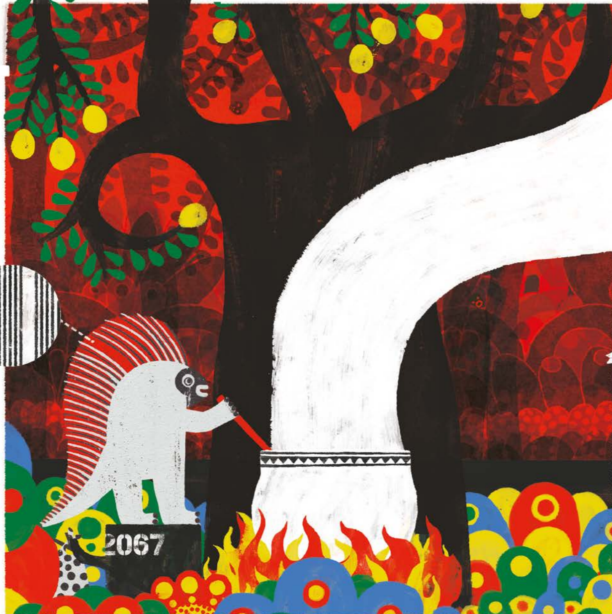
Fragment uit Alan Durant & Dale Blankenaar, Stekelsoep , De Eenhoorn, 2023. Dit fragment mag enkel gebruikt worden voor educatieve doeleinden en niet verder worden verspreid.

Noko laat de pot met water koken op het vuur. 'Het is duidelijk dat ik zelf voor eten moet zorgen,' zucht hij. 'Ik ga stekelsoep maken.' Hij trekt drie stekels uit zijn rug en gooit die in de ketel.