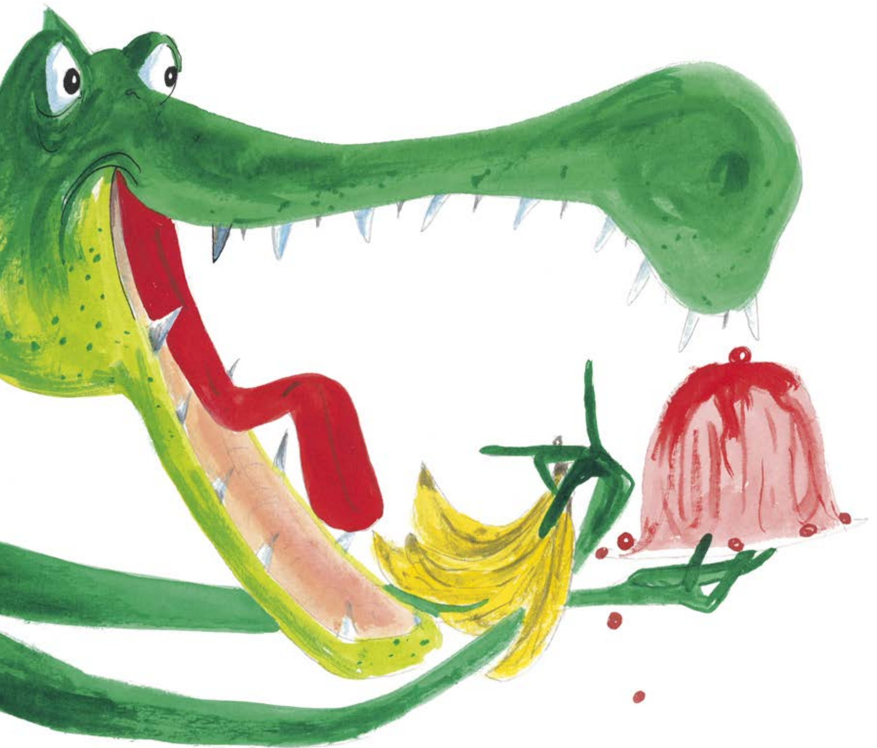
Fragment uit Harmen van Straaten, Er kwam een krokodil logeren, Leopold, 2023. Dit fragment mag enkel gebruikt worden voor educatieve doeleinden en niet verder worden verspreid.