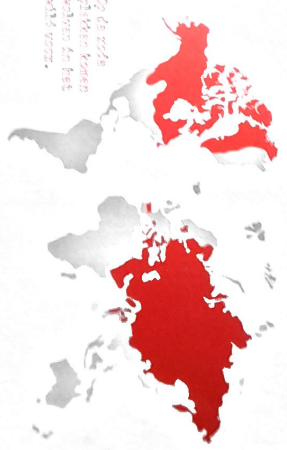
Op de rode plekken komen wolven nu best wel voor.

schieten waarschijnlijk hadden oermensen respect voor wolven en andersom. Wolven weten dat mensen vuur hebben en met stenen kunnen gooien of ergen. En dat ze samenwerken, net als zij. Wolven zoeken liever een makkelijkere prooi. Maar toen mensen schapen gingen houden, konden de wolven daar toch niet van afblijven. Boeren en herders kunnen wolven daarom wél schieten en dat hebben ze ook eeuwenlang gedaan, vooral in Europa en in Noord-Amerika. In veel landen werden ze uitgeroeid. In 1743 in Engeland en ruim een eeuw later in Nederland en België.